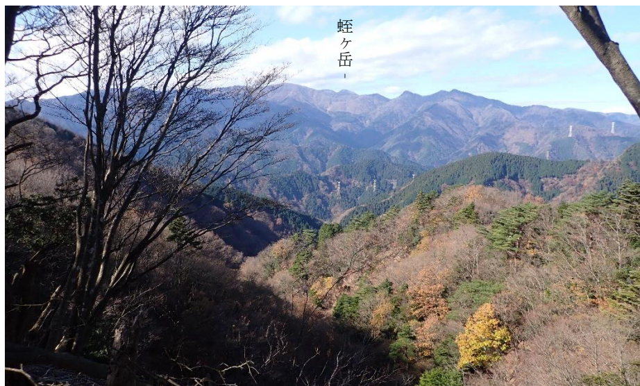
広がる森の奥に丹沢最高峰の蛭ヶ岳