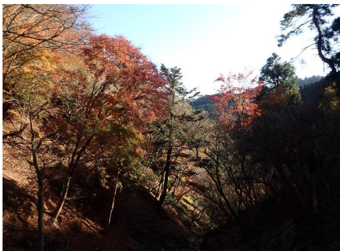
カエデの仲間の紅葉