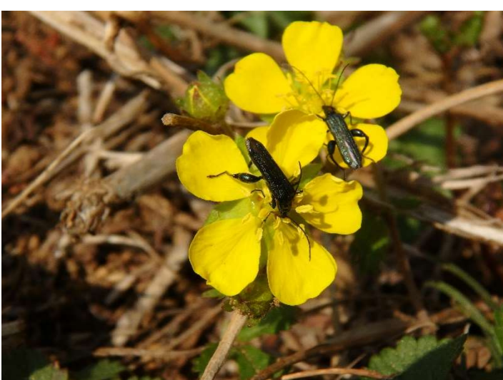
ミツバツチグリの蜜を吸うモモボトカミキリモドキ