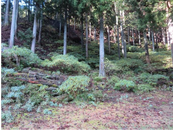
ミツマタの群生地