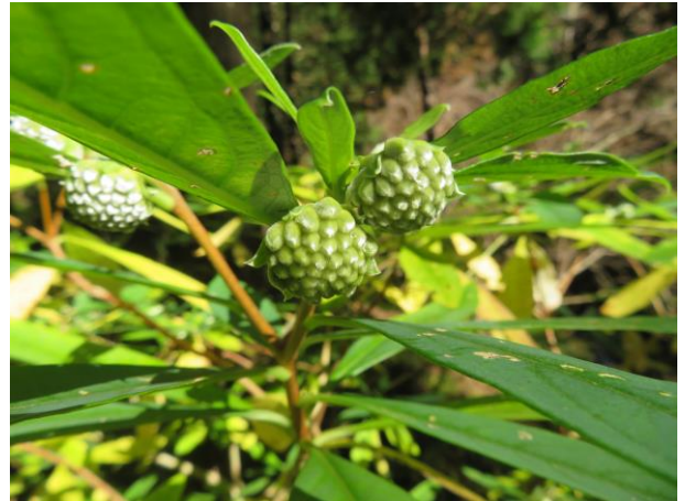
ミツマタのつぼみ