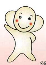
公園のマスコット「みっちゃん」