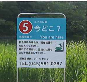
セキュリティポスト 園内に設置されたセキュリティポストの番号と、公園マップの番号を照らし合わせて、居場所を確認することができます。また、緊急連絡先（パークセンター）の電話番号を確認できます。