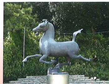
天馬 神奈川県との友好を記念して、中国遼寧省から贈られました。このブロンズ像は、漢墓から出土した「馬超竜雀」という天馬を複製したものです。