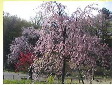
花の広場 この広場では、見事な紅枝垂桜や八重紅枝垂桜、枝垂染井といった3種の枝垂れ桜を一度に見ることができます。

江戸時代に、灌漑用水池として築かれた三つの池が、公園の名前の由来です。これら三つの池と、豊かな緑に囲まれた三ツ池公園は、都会の喧騒を忘れさせてくれるほど、静かな時間が流れます。昔から行楽地として人気がありました。