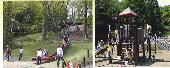
遊びの森 斜面を利用したロングすべり台は、木々の間を滑り下り遊び心たっぷりです。また、すべり台や登り棒などを組み合わせた複合遊具もあり、子どもに人気の場所です。