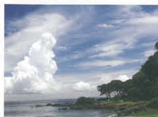
観音崎園地 (村田光正)