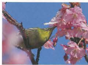
花の広場 (国分敬之)

※第1, 2駐車場から森のロッジ、花の広場、戦没船員の碑方面は三軒家トレ前三叉路経由の道 ※美術館から森のロッジ、花の広場、戦没船員の碑方面は美術館裏から三軒家園地経由の道 ※第5, 6駐車場から森のロッジ、花の広場、戦没船員の碑方面は第5駐車場前の園路を通る道 ※( )内は所要時間です。時間は通常男子の歩行時間です。