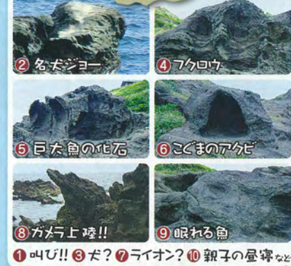
1 叫び!! 2 名犬ジョー 3 だ? 4 フクロウ 5 巨大魚の化石 6 こくまのアケビ 7 ライオン? 8 ガメラ上陸!! 9 眠れる魚 10 親子の昼寝 など