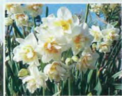
城ヶ島公園の 八重水仙

植物ウォッチングも楽しみの一つです。1月下旬には春一番の花だよりとなって県内を駆け巡るスイセンをはじめ、さまざまな海浜植物を目にすることができます。その一方で、強風により変形したマツの姿や、波に削られた岩礁などの荒々しい風景が自然環境の厳しさを物語ります。