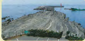
▲ 丘の上からの景色(灘ヶ崎)

▲ 楯の三郎山(楯ノ神社) 小高い丘の上にある楯ノ神社は、航海の安全と大漁を祈願する漁業関係者が参拝に訪れます。また、丘の上からの景色も最高です。