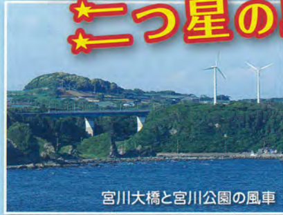
宮川大橋と宮川公園の風車