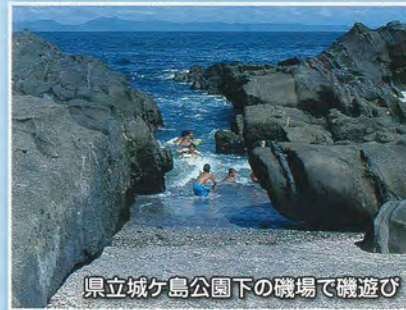
県立城ヶ島公園下の磯場で磯遊び