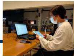
コーディネーター