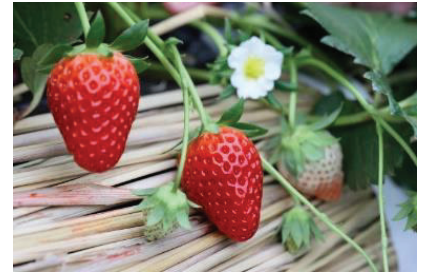
イチゴ新品種「かなこまち」