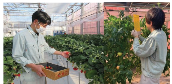
スマート農業の試験栽培を行う「ICT温室」