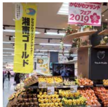
かながわブランドフェア