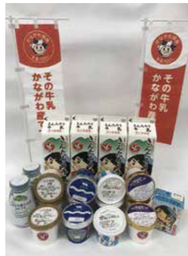
かながわ県産生乳100%認証制度 認証済み製品