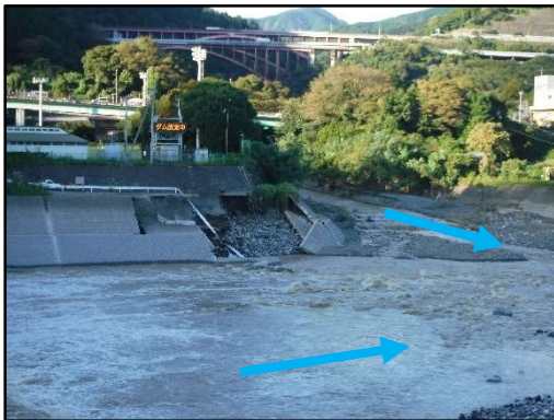
酒匂川 皆瀬川合流部左岸