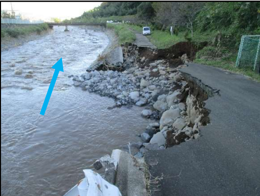
狩川 新上河原橋下流右岸