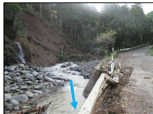
畑沢 1号橋上流右岸