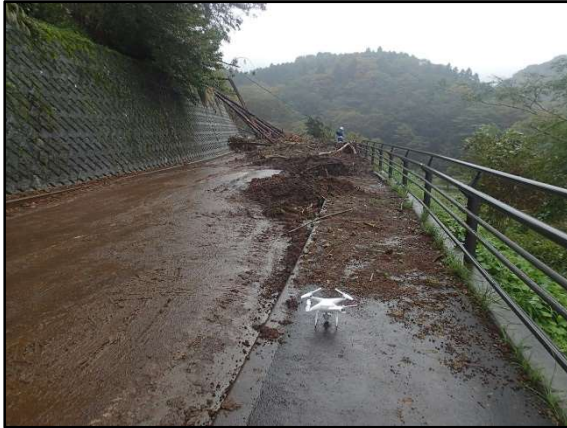
県道78号(御殿場大井) 地蔵堂～足柄峠 法面崩落