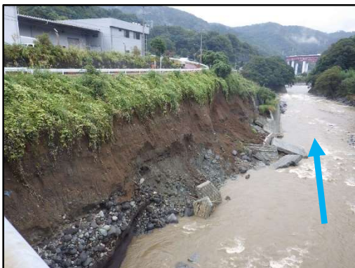
酒匂川 谷戸大橋下流左岸