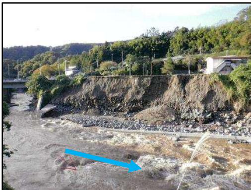
酒匂川 新鮎沢橋下流左岸