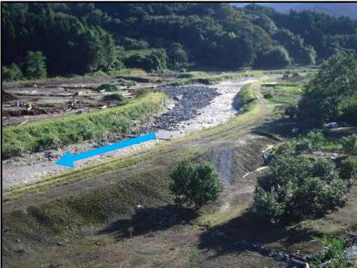
内川 水神面橋～尾崎橋右岸