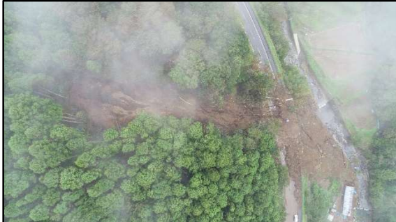
県道76号(山北藤野) 西丹沢自然教室付近 陥没