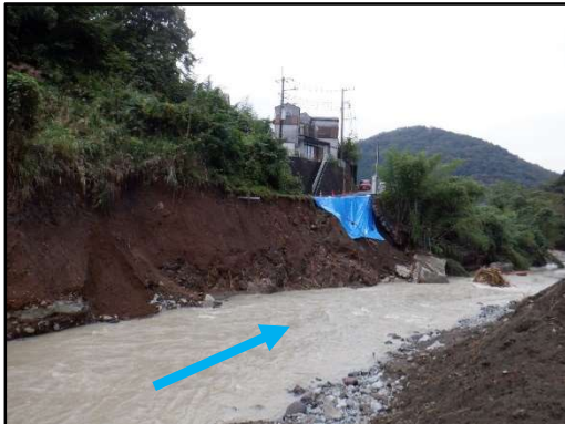
中津川 湯ノ沢橋上流左岸