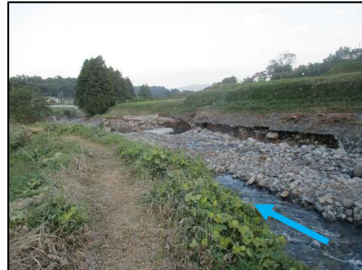
狩川 日陰橋下流右岸