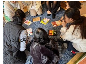
③選んだ本を見せ合う