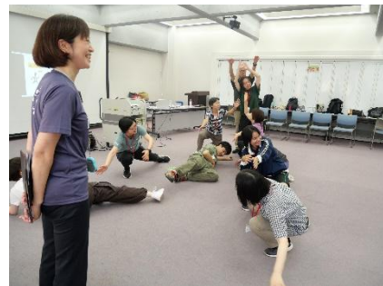
上から下へ流れるよう 何を表現しているかな