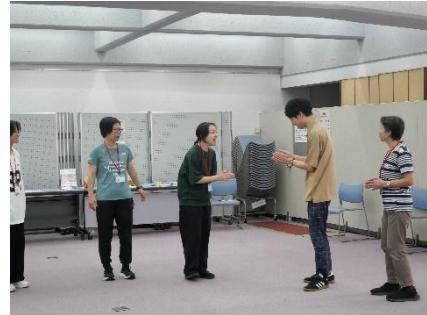
はい！と言って 発信と受信のタイミングを合わせる

アクティビティの中でその働きを体験することで、受講者は日常のコミュニケーションのヒントを得ていたほか、「子どもや若者向けに持ち帰って実践したい」、「教室で居心地のいい空間を作れるように今日の体験を活かしていきたい」といった肯定的な反応が示された。