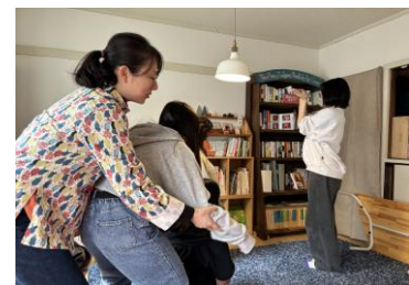
それぞれのエピソードを全員で演劇にする