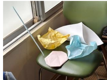
②「表現に向けた導入」 みんなの自分の気持ちの形を部屋に展示