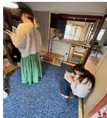
②「表現に向けた導入」本選び