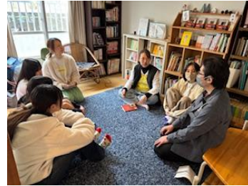
①「ウォームアップ」お互いを知ろう