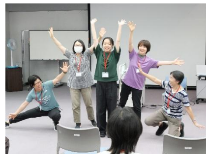
互いに認め合う姿勢 それがイエスアンド