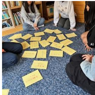
③テーマカードを床に広げる