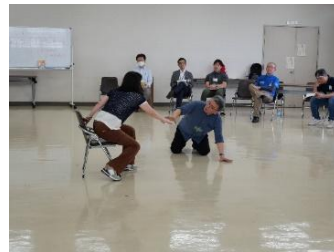
渾身のアジャジャオジャジャ

き席を譲ってもいいと思えたら交代といったゲームであった。表現を使ったゲームとしては特に盛り上がり、言葉を使うことができないので表情や抑揚、身体の動きにも注目が集まった。最後は「バーン」という5人組のアクティビティで、「バーン！」と言いながら両手を挙げる人数を1人、2人、3人…と増やしていき5人目までそろそろことを目指すゲームで締めくくった。チームで息を合わせる様子がみられ、全員が笑顔で取り組む様子が窺えた。