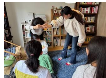
③トークテーマのひとつを動きで表現する