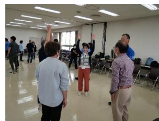
バーン！ タイミングよくみんなで手を挙げていく