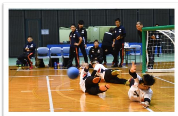
ゴールを守る男子日本代表

選手は、ボールの中に入った鈴や、相手選手が動く足音など、かすかな音を頼りにプレイしているので、試合は静寂の中で行われます。選手に声援を送ることができるのは、オフィシャルブレイク中（ゲームタイマーが止まっている間）のみ。大会では音楽を流して応援できるタイミングがわかるよう工夫しています。選手がプレイしている間は応援したい気持ちをグッとこらえて、心の中で声援を送りましょう。プレイが始まる前に審判が「クワイエットプリーズ! (Quiet Please!)」(お静かに!)のコールをします。これが静かにする合図。ゴールが決まった直後やゲームタイマーが止まった時だけ大きな歓声を送ることができます。