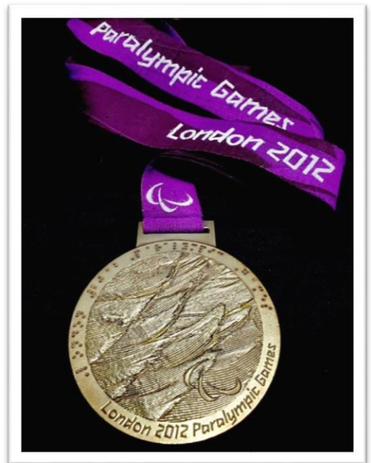
ロンドンパラリンピックの“金メダル”

好きな言葉は“挑戦”です。元々スポーツがあまり好きではなく、体育の授業は見学ばかりしていましたが、ゴールボールに挑戦してみてから、私自身がずいぶん変わったのではないかと考えています。挑戦することは