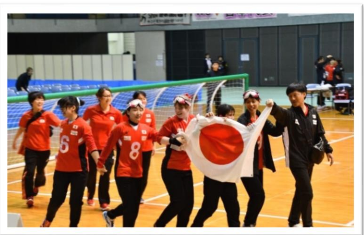
“2019 IBSA ゴールボール アジアパシフィック選手権大会 in 千葉” の決勝戦でライバル中国を破った女子日本代表チーム