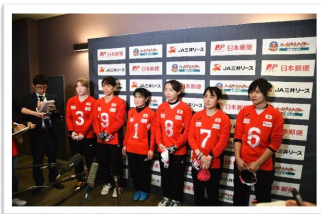
ライバル中国代表を倒し、優勝した女子日本代表