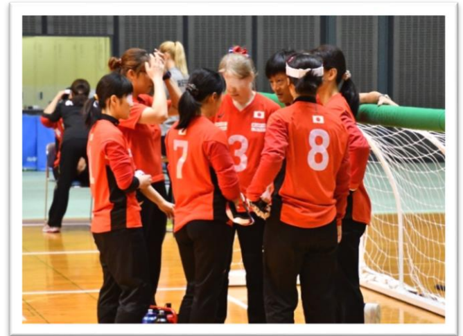
試合前のミーティングの様子

A. 選手を励ます言葉や、「今、得点されたプレイはこんなプレイだったから、次はこういう所を注意しよう」といった話です。タイムアウトは45秒と短く、長々とした話ではできないので、攻撃の狙い所の確認などをします。短い時間ですが、チームの気持ちを1つにしていくという意味でも、タイムアウトはとても重要です。タイムアウト後に試合の流れが変わることも多いので、観戦時の注目ポイントだと思います。