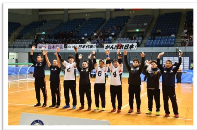
韓国代表に勝って、3位入賞した男子日本代表