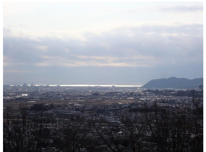
吾妻山からの景色