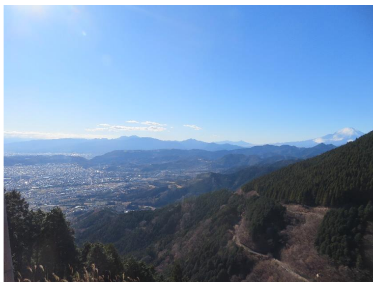
菩提峠周辺からみた展望