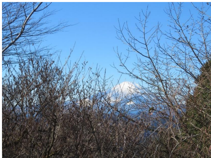
岳ノ台展望台からの富士山