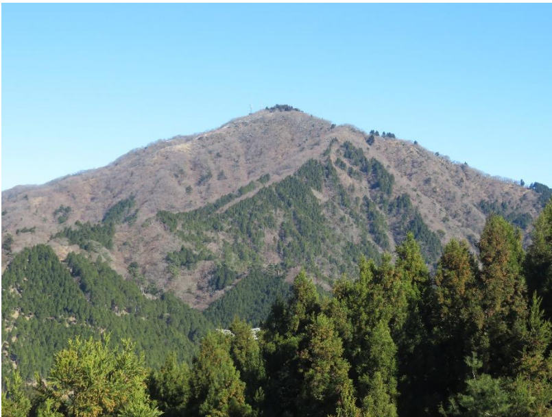
岳ノ台展望台から見た大山方向 よく見ると北斜面の山肌に雪が残っている