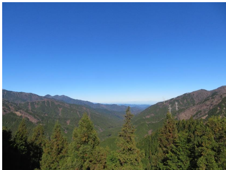
岳ノ台展望台からの北側の展望