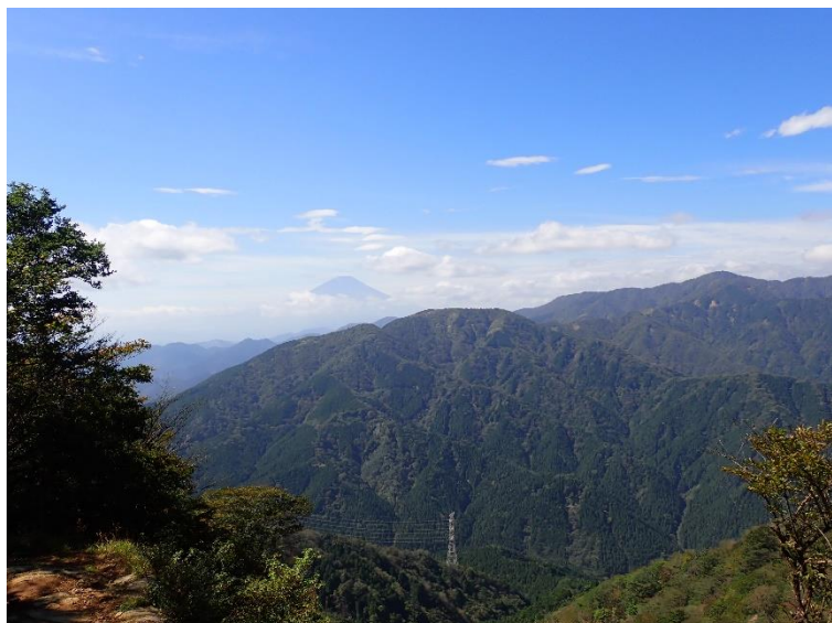
イタツミ尾根分岐手前の展望地

●秋晴れのこの日は、イタツミ尾根分岐付近からは富士山が見えました。山頂も展望が良く、麓の街並みを見渡せます。パークレンジャーの事務所、自然環境保全センターも見えました。