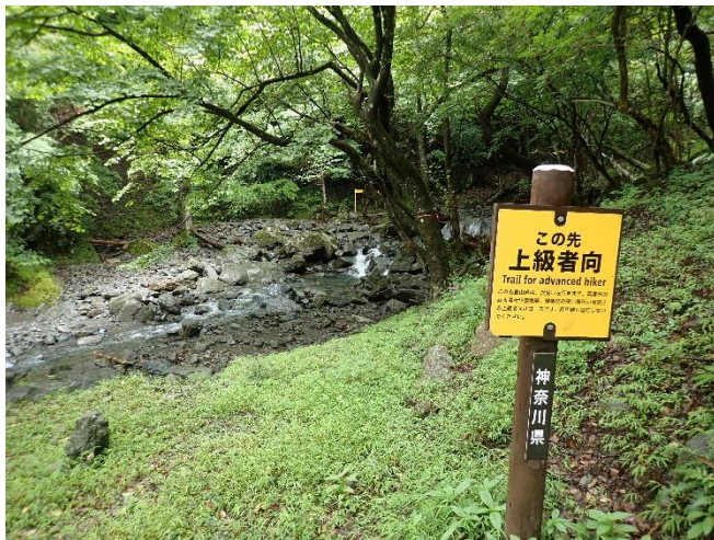
登山口の様子 早速、沢を渡渉します。