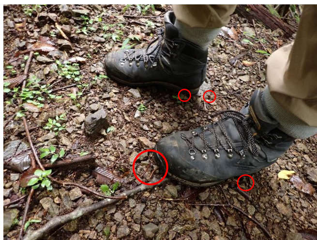
地面に同化していますが赤丸内がヤマビル