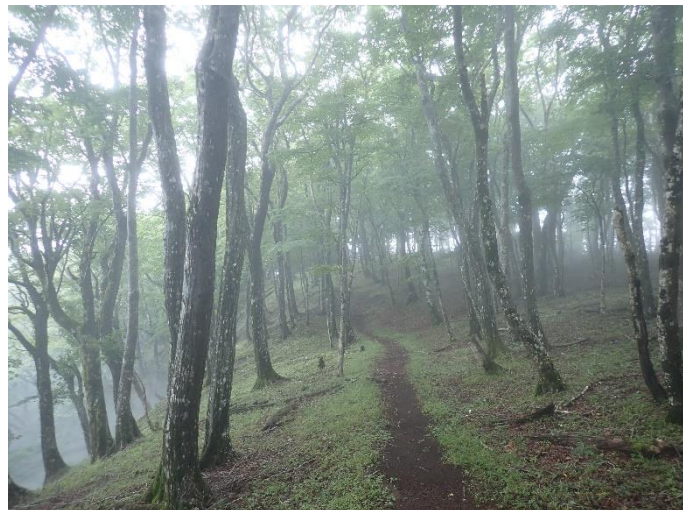
長尾尾根合流点の様子