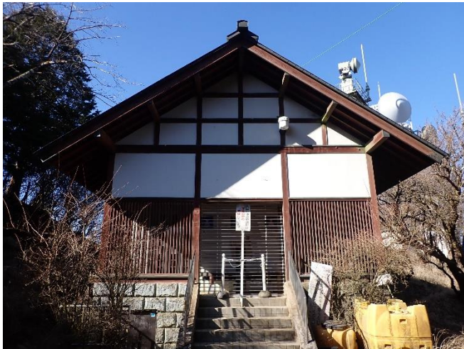
閉鎖中の大山山頂公衆トイレ

https://www.city.isehara.kanagawa.jp/kankou_guide/docs/2021112500033/