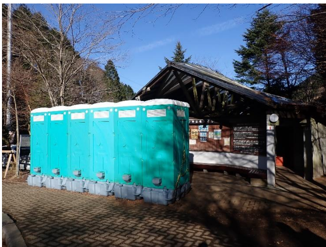
ヤビツ峠公衆トイレと仮設トイレ