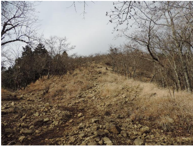
二ノ塔のガレ場（2014年12月9日）

●神奈川県では登山道の補修整備に関して、団体との間で協定を結び、いくつかの決められた路線で登山道の補修活動を行っていただいています。富士見橋から二ノ塔間もその路線の1つです。二ノ塔手前のガレ場は、以前は道が複線化し、踏圧等の影響で植物があまり育たない状態でした。協定団体さんの活動の一環で、複線化した道を石で塞ぎ登山道を一本化したことによる効果もあり、植生が回復している様子が目に見えて感じられます。