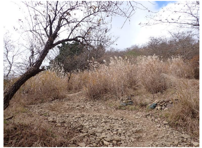
現在の様子（2021年11月17日）