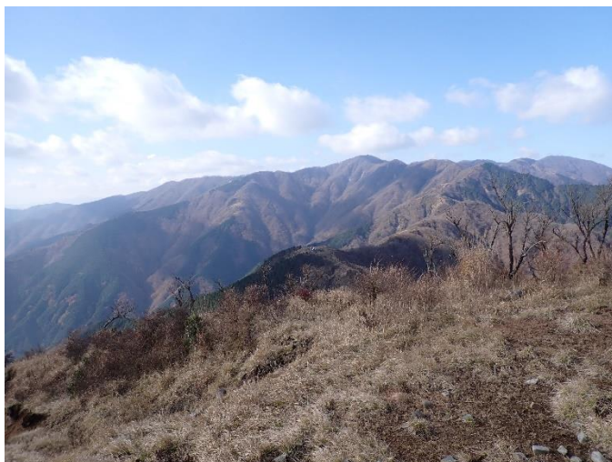
三ノ塔山頂から表尾根方面