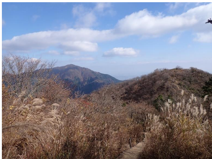
三ノ塔山頂手前から二ノ塔・大山方面