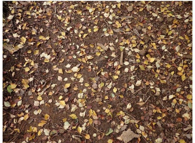
マメザクラの黄葉と落葉した葉