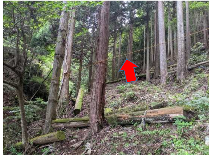
作業道入り口に張られた侵入防止のロープ

● 登山道沿いに付けられた目印テープを誤解して迷うこともよくあります。目印テープが登山道を示すとは限りません。山の中では様々な目的で目印テープがつけられています。間伐や治山工事が行われている所ではよく見かけるので注意しましょう。