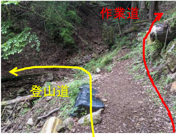
迷い込みそうな作業道との分岐

道迷いの一つに間伐などの作業道に迷い込むこともあります。作業道の方が目立ったり、歩きやすそうに見えることがあるためです。地図の確認や、付近の様子を気にするようにしましょう。