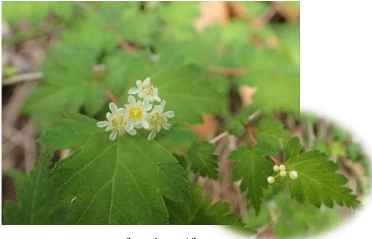
コゴメウツギ 名前の通り、蕾は小さなお米のよう