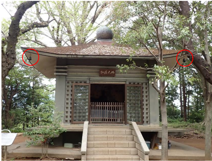
弘法山山頂のお堂