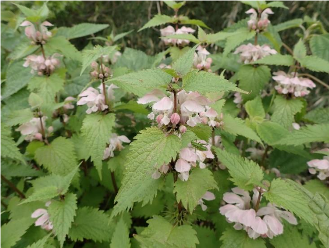
オドリコソウ 日本にもともとある在来種です (ヒメオドリコソウは外来種)