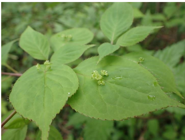
ハナイカタ 雄花 葉の上に花を咲かせるユニークな植物