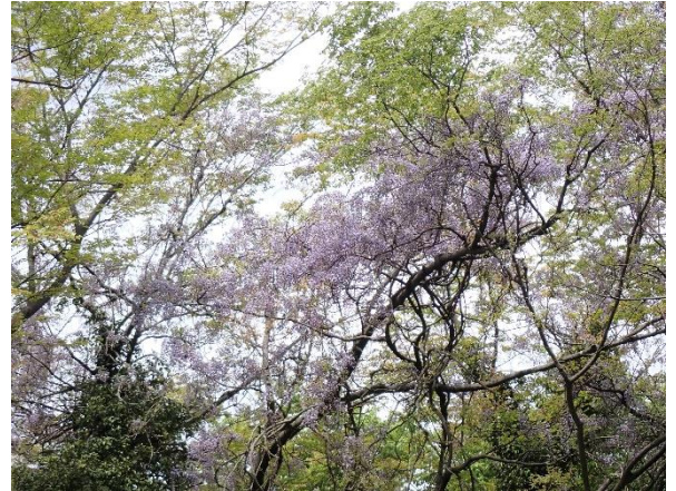
フジ 早くもフジの季節がやってきたようです