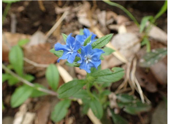
ホタルカズラ 瑠璃色が鮮やかなかわいらしい花です