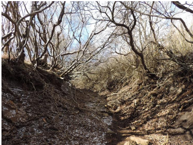
工事前の二ノ塔山頂直下の様子

●二ノ塔や三ノ塔山頂にかけて、ぬかるみのひどい箇所への木道・構造階段の設置や、古くなった木道などの交換が行われ、登山道が歩きやすくなりました。これは、直接土壌や植物を踏まないようにすることで、侵食を防ぎ、植物や土壌を守るために設置されています。