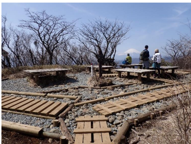
きれいに整備された二ノ塔山頂