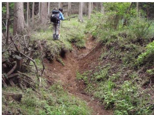
2008年6月補修前の様子

●12年前（2008年）に自然公園指導員さん達による補修隊で、土壌保全と植生回復のための作業を行った個所の経過を見ました。少しずつ回復している様子がうかがえます。