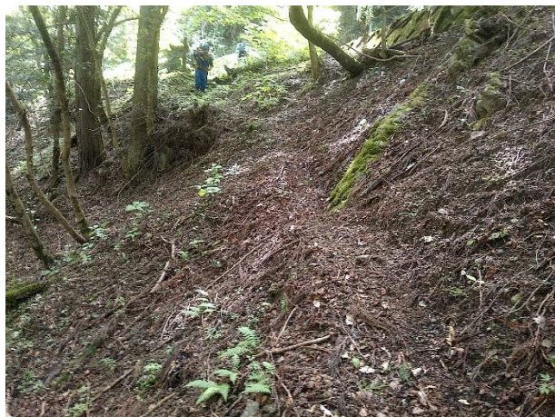
階段工設置（作業前）