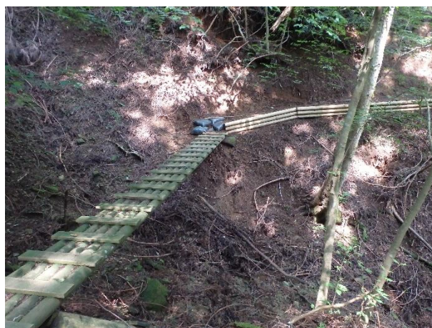
木橋の据え直し（作業後）