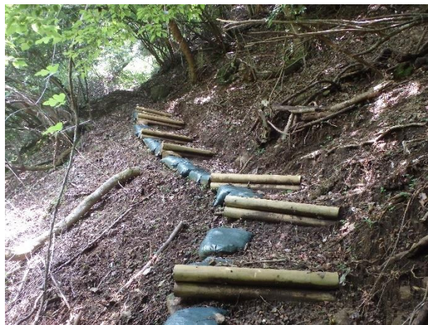
階段工設置（作業後）