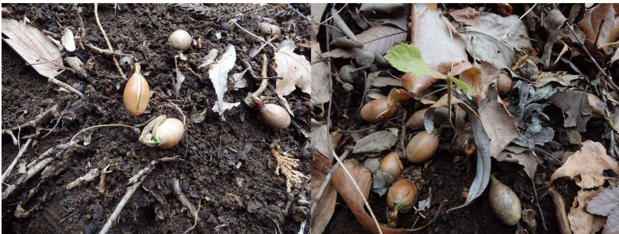
(写真) 左：発根しているどんぐり

●発根・発芽しているどんぐりを見つけました。よく見ると先のとがった方から根や葉を出ています。母樹の下に落ちて発芽したどんぐりのほとんどは成木となれません。ここにも沢山落ちて発芽していましたが、いつまで生き残ることができるでしょうか。