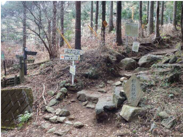
(写真1) 登山口の様子

●“関東ふれあいの道”の一部である日向から見晴台までを登りました。登山口は日向ふれあい学習センターの横にあります。