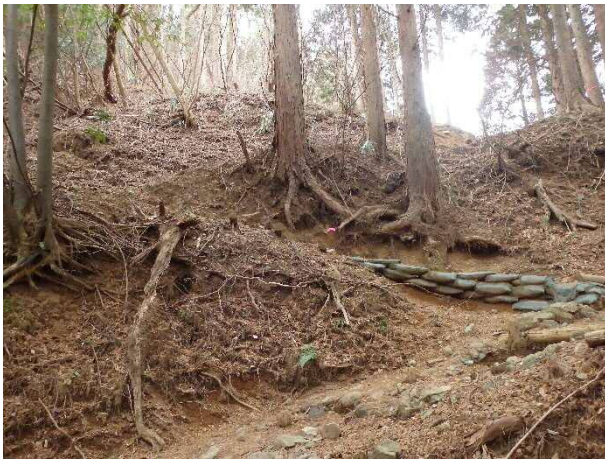
(写真2) 九十九曲の様子

●一度、林道との交差を過ぎると、登山道はいよいよつづら折りに登る“九十九曲”に入ります。