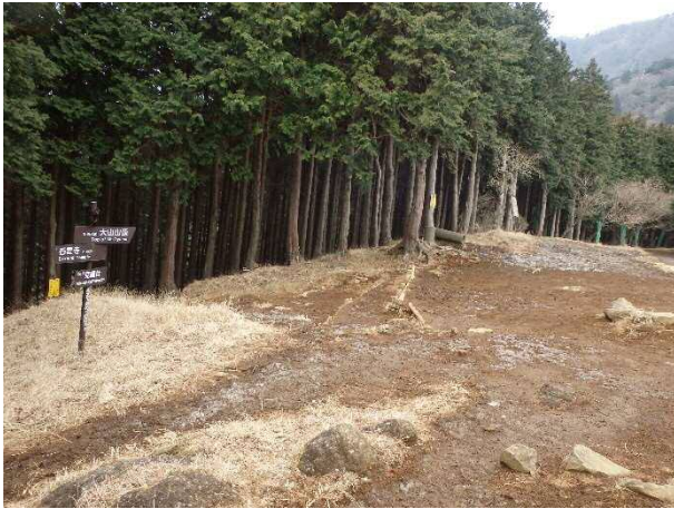
(写真 5) 見晴台の様子

●見晴台は霜柱が残っていて地面も凍っていましたが。この日は寒く、お昼頃にほんの少し雪がちらつきました。