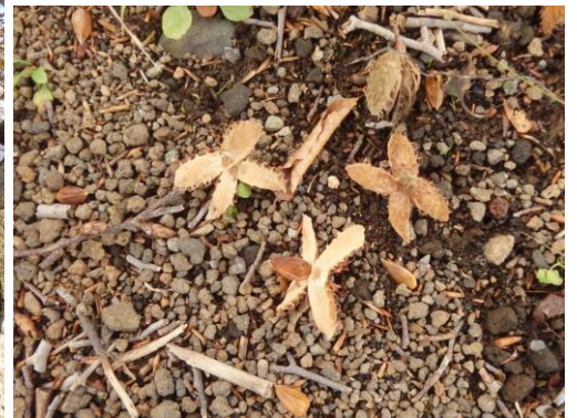
足元にはブナの実