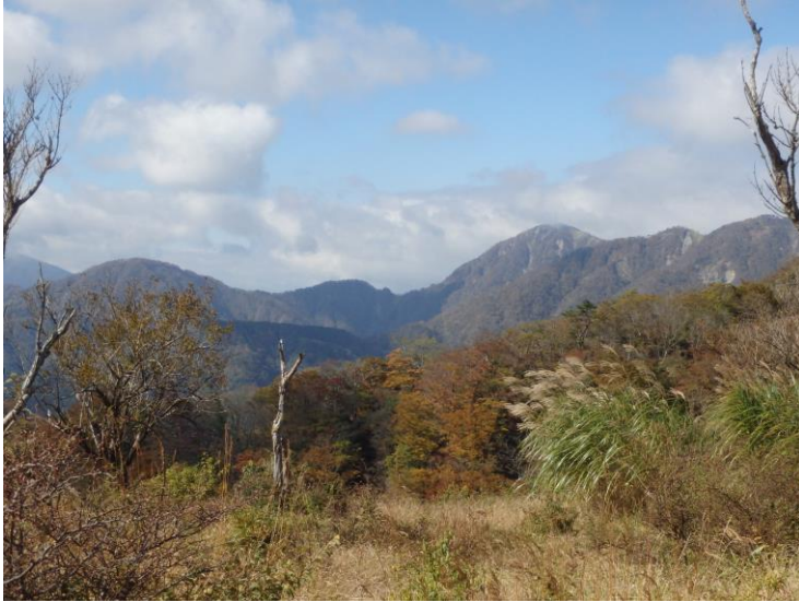
神奈川最高峰の蛭ヶ岳も見えました（写真中央右）

●稜線はお昼でも気温が10度と寒かったです。また、秋は日の入りがどんどんと早くなります。余裕を持った登山計画を立てて、防寒具とヘッドライトを持ち、秋の丹沢をお楽しみください。