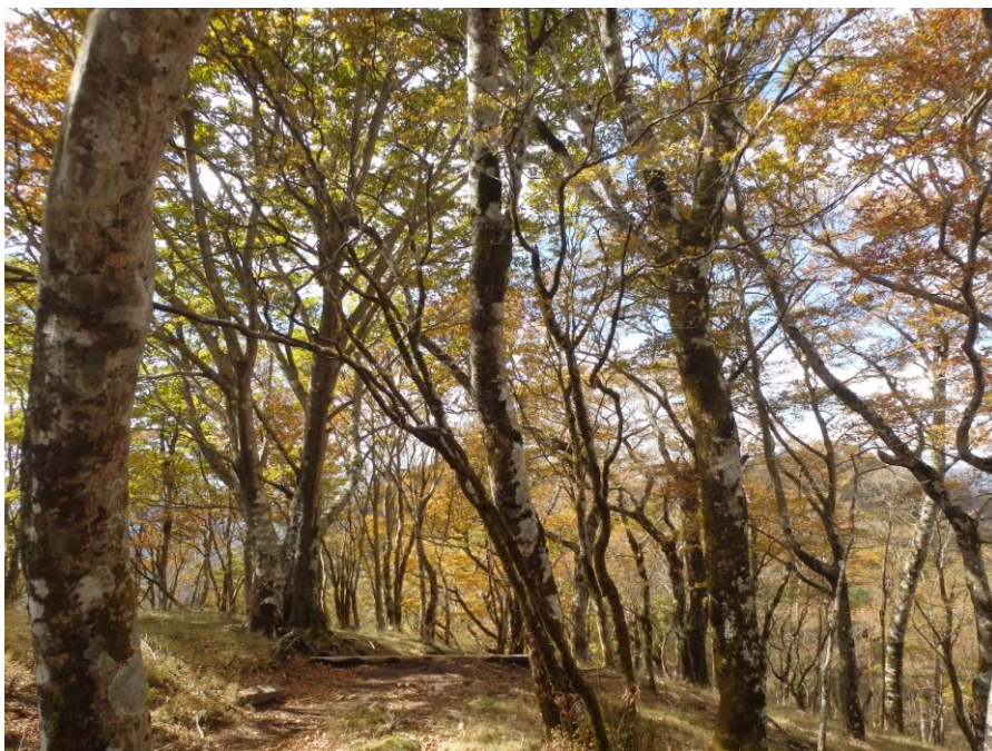
鍋割山稜のブナ林

● 鍋割山稜はブナやカエデ類等の自然林が美しく、気持ちの良い稜線歩きを楽しむ事が出来ます。樹種や日当たりにもよりますが、標高1000メートル以上で紅葉が見頃を迎えていました。