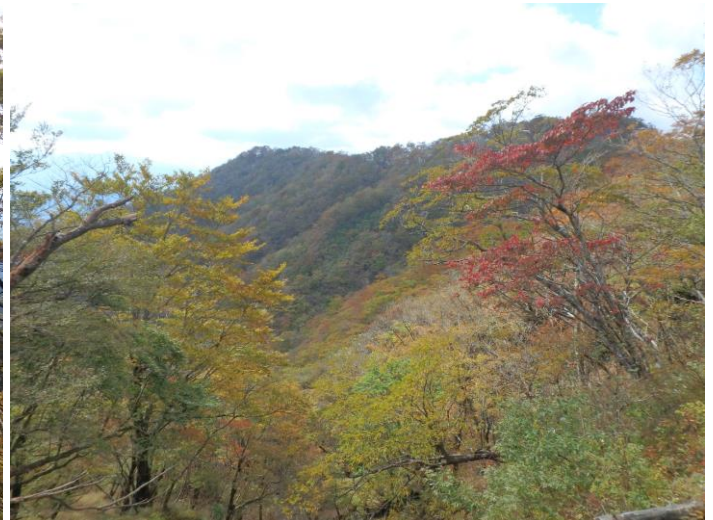
大倉尾根 金冷シ周辺から鍋割山稜方面