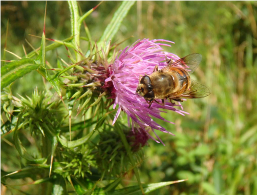
タイアザミと蜜を吸うアブの仲間