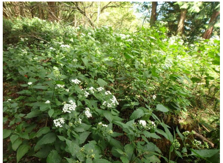
マルバフジバカマ