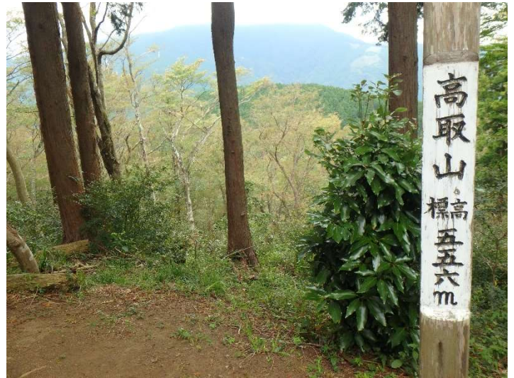
高取山山頂（秦野市）

●コース上ではマルバフジバカマの分布が広がってきているのが気になります。マルバフジバカマは北アメリカ原産の帰化植物で、日陰、特にスギ植林の下に多く生えます。白い花がまとまって咲いているのはきれいに見えますが、帰化植物の分布の密度があまり高くなると、在来種の生育に影響を及ぼすことが懸念されます。