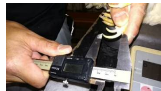
図2 爪の長さの測定