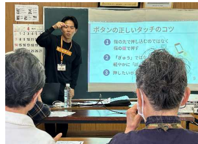
社会福祉協議会やNPO法人主催の多世代交流型スマホ教室【株式会社AgeWellJapan】