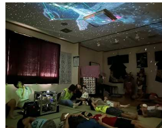
自治会イベントでの屋内プラネタリウム【株式会社アストロコネクト】