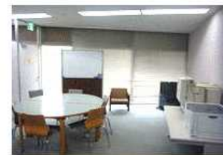
④ ミーティングスペース