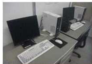
③ パソコンコーナー