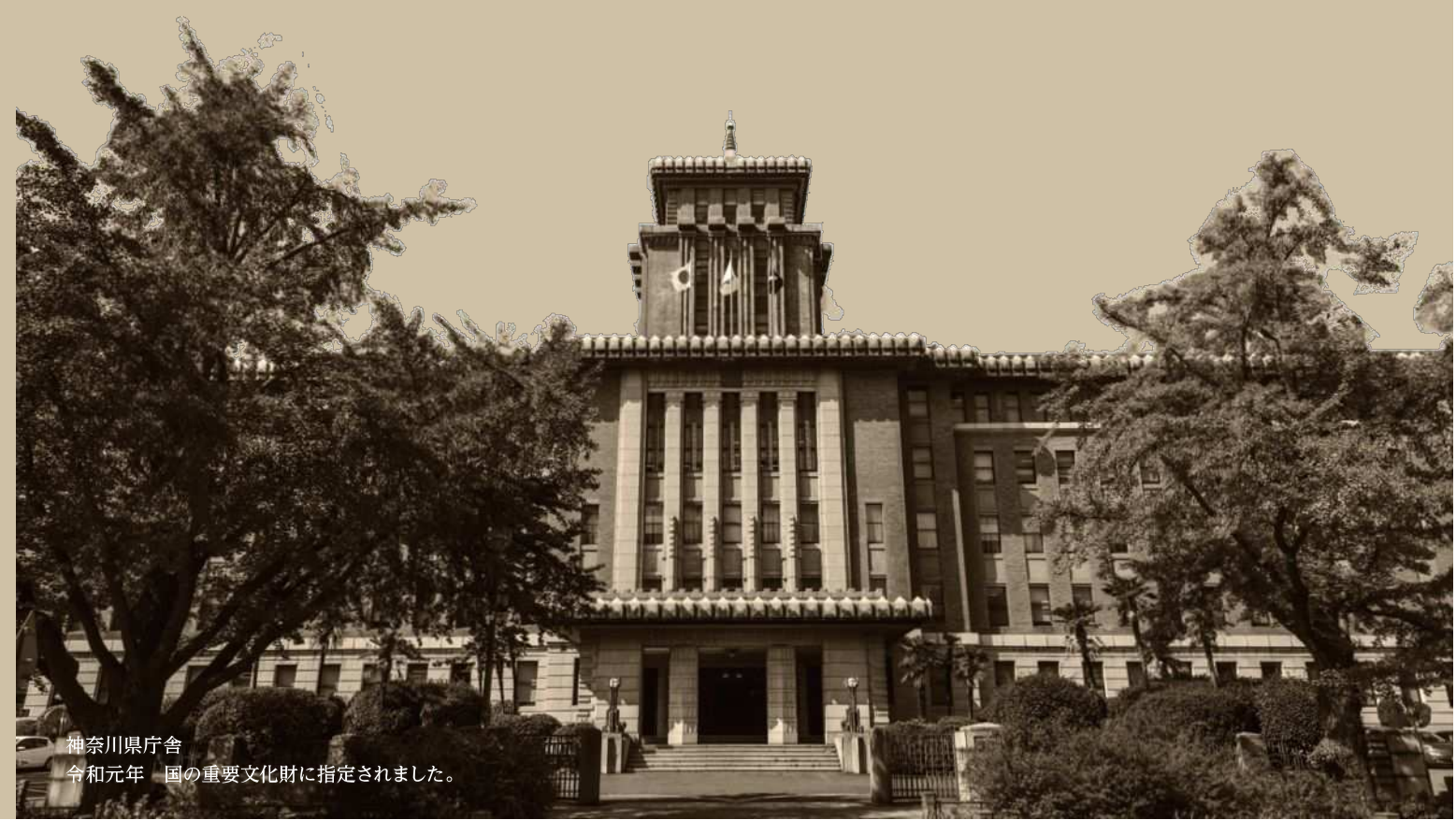
神奈川県庁舎 令和元年 国の重要文化財に指定されました。

https://www.pref.kanagawa.jp/docs/ar3/taikou.html