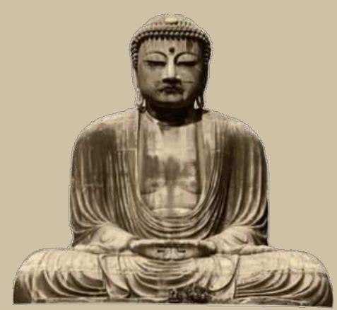
銅造 阿弥陀如来坐像（鎌倉大仏）鎌倉市：国宝