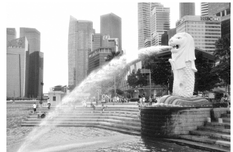
【修学旅行（シンガポール）】