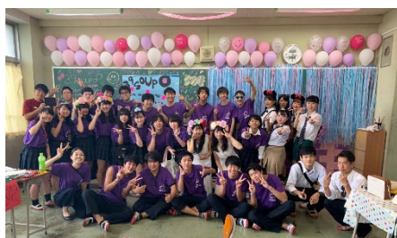
ひしょうさい 飛翔祭(文化祭)