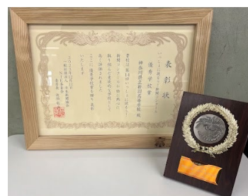
新聞コンクール表彰状と盾

授業を通じて校外での取組にも積極的に参加しています。令和5年度には第1回横浜開港資料館ミュージアムグッズデザインコンテストで審査員賞、第14回「いっしょに読もう!新聞コンクール」で優秀学校賞を受賞しました。