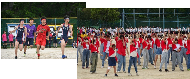
風音祭体育部門。演舞は必見！

スポーツも芸術も、みんなで工夫しながら親しめる環境が、清新潑刺とした百合丘を創りあげています。