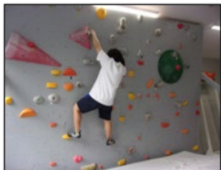
ワンダーフォーゲル部