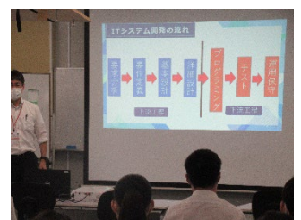
進路オリエンテーション