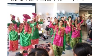
インドから来校の中高生と交流