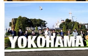
校内外留学生とウォーキング

みなと総合高校では、国際交流活動が盛んです。上海の姉妹校とマレーシアの交流校へ訪問しています。また、海外から年間留学生を受け入れています（開校から20か国以上）。生徒の自主的な国際交流を重視し、担当のGEUとMateが企画・運営します。海外からの訪問校イベント、留学生との交流、学年ミックスの意見交換イベントもあります。入学時の多文化理解プログラム、国際研究豊富な方の講演会やフィールドワーク（横浜、東京、南三陸など）、AETとのランチ・トーク、校外へ出て英語で議論する横浜学生会議への参加、米国国務省研修生交流など活動は多彩です。