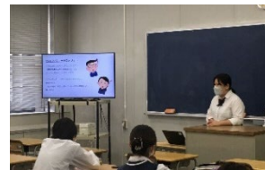
探究発表会の様子

1年次の「産業社会と人間」、2・3年次の「総合的な探究の時間」では、様々な体験や講話、探究活動などを通して、自らを見つめ、卒業後の進路やこれからの人生をどのように生きていくかを考えます。神奈川大学や関東学院大学との連携講座、自らの興味関心やSDGsに関する探究活動、地域や近隣企業と課題解決に向けてのプランの提案など、社会との関りを大切にしたり取り組みを進めています。活動を通して仲間と協働して課題に取り組む力や、答えのない課題に対して試行錯誤する姿勢、プレゼンテーションなどの表現力を身に付けます。