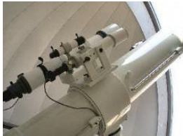
35cm 反射望遠鏡 (ドーム式)