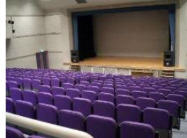
劇場イス・16チャンネル音響 設備・ビデオプロジェクター