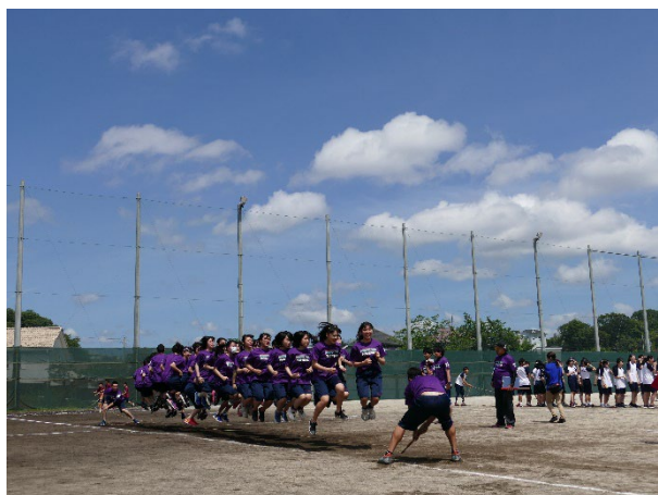
クラスの日(体育的行事)

過去3年間の進学先は、国立電気通信大学、慶應義塾大学、早稲田大学、県立保健福祉大学、横浜市立大学、法政大学、中央大学、東洋大学、神奈川大学、青山学院大、日本大学、日本体育大学、明治学院大学等と多岐にわたっています。進学方法も、総合型(AO)、学校推薦型選抜、一般入試と様々な受験方法で進学をしています。また将来の職業を見据え専門学校をめざす生徒や公務員試験に合格する生徒もいます。