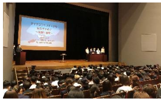
探究成果発表会（関内ホール）

さらに、2年生からは「課題研究」をすすめます。グループや個人が選んだテーマをもとに「研究」を重ね、それを「まとめ」、人に「伝える」ことを目指します。