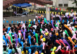
(文化祭オープニング)