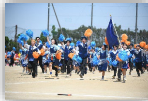
体育祭のダンス(2023年度)