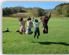
修学旅行(2022年度 北海道方面)