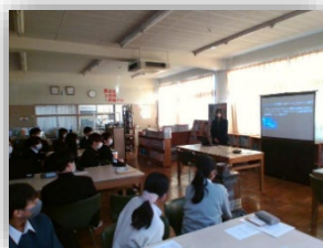
総合的な探究の時間

★「総合的な探究の時間」では、研究開発校として3年間をとおしてよりよい未来を切り拓くための課題解決力と行動力を育みます。