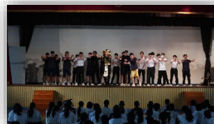
文化祭・ステージ発表(2023年度)