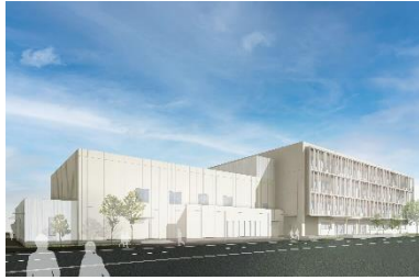
新校舎 完成予定図