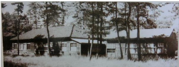
仮校舎全景(昭和32年)

平成28年度からは「プログラミング教育研究推進校」の指定を県より受け、新時代を切り拓くリーダーの育成に取り組んでいます。