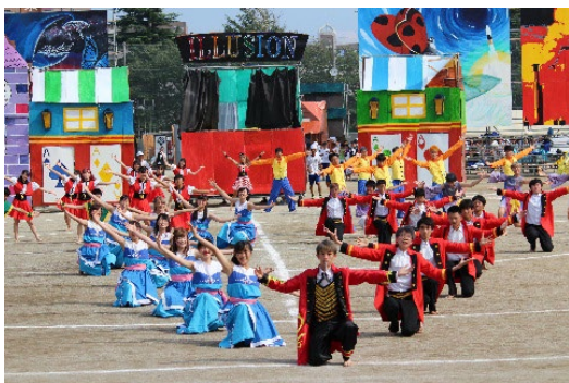
色別で熱戦を繰り広げる体育祭