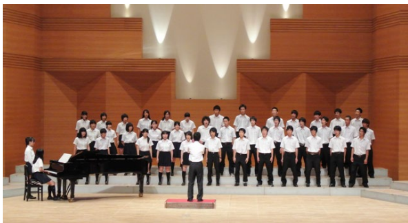
クラス対抗の合唱コンクール

このように年間を通しての行事は、本校の特色の一つといえます。そして湘南生は、これらの行事それぞれに積極的、かつ集中的に取り組むと同時に、時間に区切りをつけ、巧みに頭を切りかえて学習にも励み、充実した学校生活を送っています。