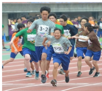
対組競技の始まりとなる陸上記録会

施設 は、平成7年に湘南の海をイメージした現在の校舎が完成し、冷暖房完備の多目的ホールやセミナーハウス (合宿所) も作られました。これらの施設は、文化祭や定期演奏会、夏季休業中の部活動合宿や教科の講習などに利用されており、生徒の積極的な活動を支えています。平成24年に湘南高校歴史館がオープンし、平成25年には、教室にエアコンが設置されました。