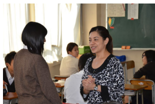
ALTの先生とは授業でも休み時間でも会話OK

3年生になると、進路に結び付いた外国語・国語・数学・地理歴史・公民・理科の発展学習を含む科目や、「フードデザイン」、「幼児教育音楽」といった科目があります。将来を見つめる君たちに役立つ科目がきっとあるはずです。