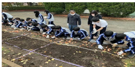
チューリップ球根植え（1年生）

勉強と部活動だけが高校生活ではありません。霧高では学校行事も盛んです。9月に開催される『霧高祭』は、全校生徒が一丸となって盛り上げる最大のイベントです。