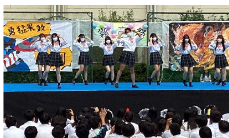
『霧高祭』人気のダンス・パフォーマンス

その他、前庭には色とりどりのチューリップが植えられています。チューリップは毎年1年生が中心となって植えて育てています。6月には『 体育祭 』を実施しています。誕生日により春夏秋冬の4団体に分かれて競い、3学年が団結します。また、7月と3月には球技4種目をクラス対抗で戦うクラスマッチが生徒に人気の行事です。