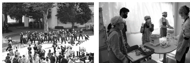
＜ 令和5年度の文化祭 ＞

通信制なので、部員が同じ時間に集まりにくい環境ですが、地道に活動しています。勉強との両立を前提にしつつ、充実した学校生活を過ごしています。