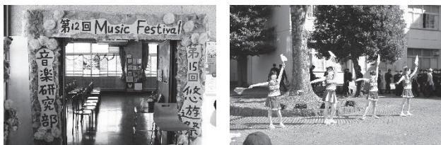
＜ 令和4年度の文化祭 ＞