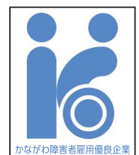
かながわ障害者雇用優良企業

障害者雇用率が4.0%以上の中小企業等を県が「かながわ障害者雇用優良企業」として認証する事業です。県の障害者雇用企業等からの物品等調達制度の対象となることが出来ます。また、シンボルマークを会社案内や名刺等に使用して、障がい者雇用に積極的に取り組んでいることをPRできます。