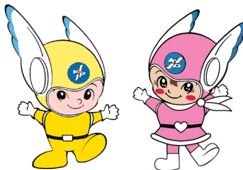
神奈川県警察シンボル・マスコット 「ピーガルくん」・「リリポちゃん」